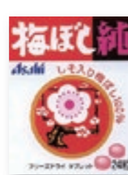
梅ぼし純(Bタイプ) [24粒/NPP]