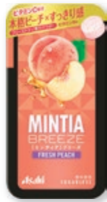
ミンティアブリーズ フレッシュピーチ [30粒(22g)/NPP]