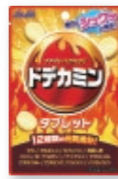
ドデカミンタブレット(小袋) [27g/NPP]