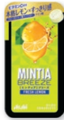
ミンティアブリーズ フレッシュレモン [30粒(22g)/NPP]