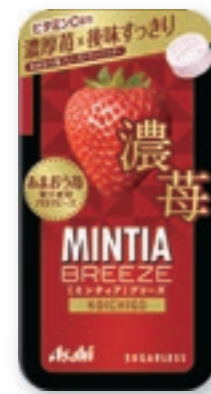
ミンティアブリーズ 濃莓 [30粒(22g)/NPP]