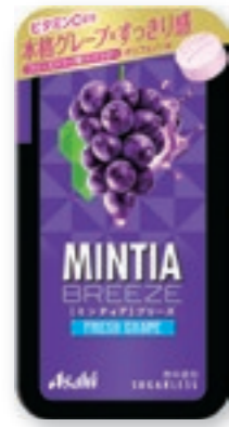
ミンティアブリーズ フレッシュグレープ [30粒(22g)/NPP]