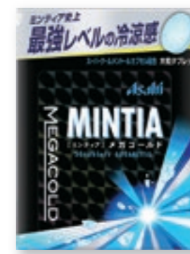
ミンティア メガコールド [50粒(50g)/NPP]