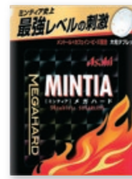
ミンティア メガハード [50粒(50g)/NPP]