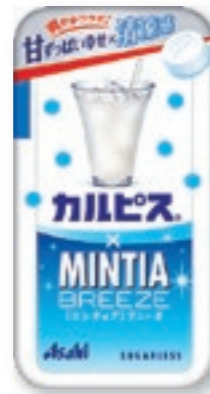
カルピス®×ミンティアブリーズ [30粒(22g)/NPP]