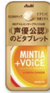
ミンティア+VOICE レモンジンジャー [30粒(20g)/NPP]